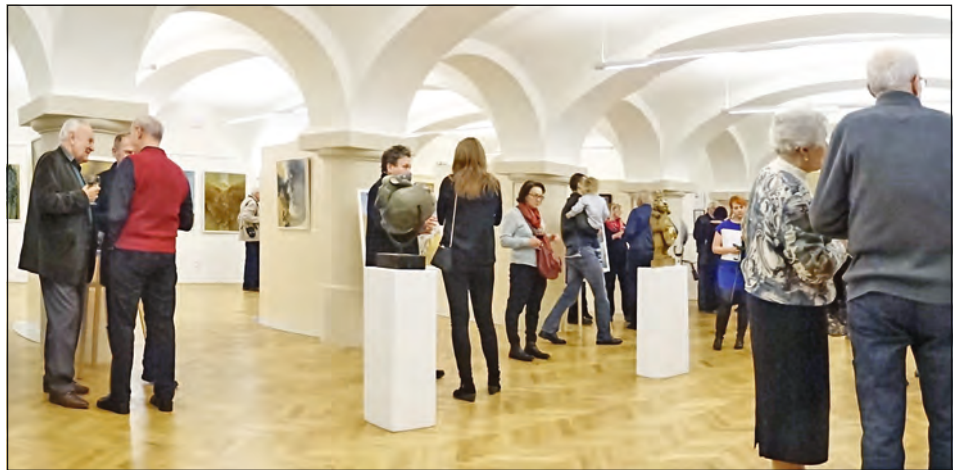
Pohledy do expozice