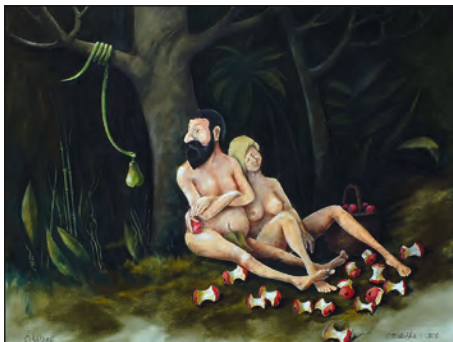
Pokušení, 2016, akryl, 70 x 90 cm