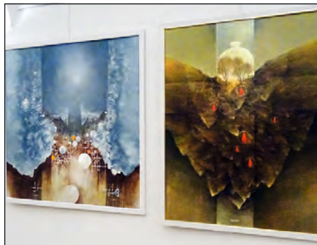
Brána světla, 2016, tempera, 103 x 103 cm Ukřižovaná krajina, 2004, tempera, 100 x 90 cm