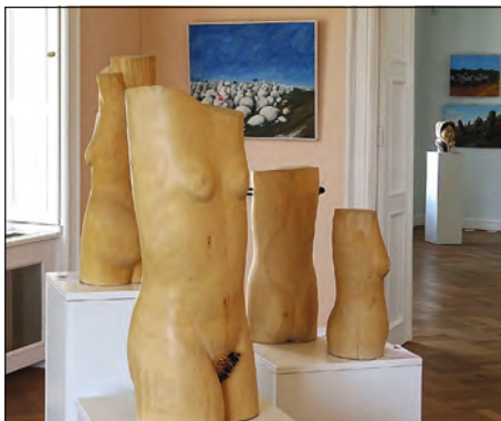
Torza aktů, z let 2000 – 2003, lípa, výška 40 – 80 cm

bojíme. Je to nejlepší doplněk stravy a nejlepší mastička na bolístky života. Návštěvníky výstavy oslovil humor laskavý a inteligentní. Obdivuhodná autorova invence je zdokumentována v jeho již dříve vydaných publikacích Usmívání a Usmívání 2 , a k výstavě vydaném katalogu Usmívání (3) , které bylo možno na místě zakoupit. Výstava Pavla Matušky USMÍVÁNÍ v Galerii Kinský v Novém zámku v Kostelci nad Orlicí trvala do 20. října.