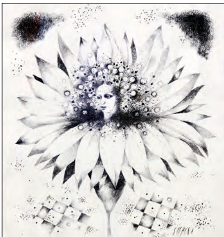
Kouzelný květ, 2008, kresba, 35 x 35 cm