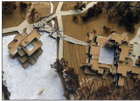
Vily na jezeře v Kolodějích u Prahy. Objednávka Úřadu vlády, 1974

Na závěr výstavy 15. března proběhla návštěva, vydařená a komerčně úspěšná derniera. Programově ji obohatila tombola z autorových prací. Jedním z výherců se stal Jan Kodeš, tenisový reprezentant, jehož dům vystavující architekt navrhoval.