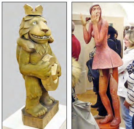
Hradec, 2012, polychrom. lípa, výška 64 cm Baletistka, nedat., polychrom. lípa, výška 124 cm

Devět prací Jaroslava Doležala na výstavě zastoupených neukazuje celou šíři autorovy tvůrčí práce a její pestrosti. Nejen poučený divák jistě cítí dlouholeté spojení umělce tvůrčího světa se světem loutkového divadla – s jeho vnitřním napětím, tragikou i komediálností. Je to právě divadelní prostředí, v němž umělec řadu let působil jako scénograf a tvůrce loutek. Vynikající řemeslné zpracování ušlechtilého dřevěného materiálu, nevšední tvarová invence, střídma a citlivě aplikovaná polychromie a především osobitý smysl pro humor a absurditu, ožívá ve vystavených volných dřevěných skulpturách vytvořených v ateliéru Jaroslava Doležala. Náměty soch prozrazují mnohé o neklidné a veselé povaze autora