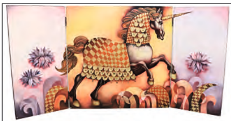
Jednorozec, 2010, olej, 100 x 200 cm