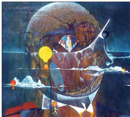
Vzduchoplavec, 2016, olej, 33 x 41 cm