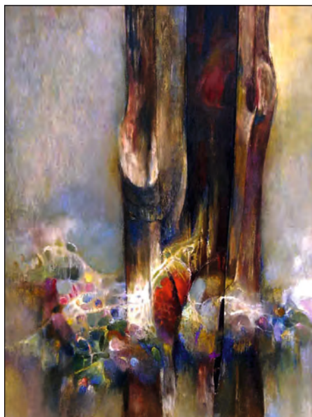
Rozkvetlý strom, 2012, olej, 124 x 95 cm