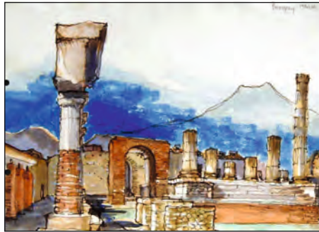
Pompei, 2001, studijní kresba, 32 x 45 cm