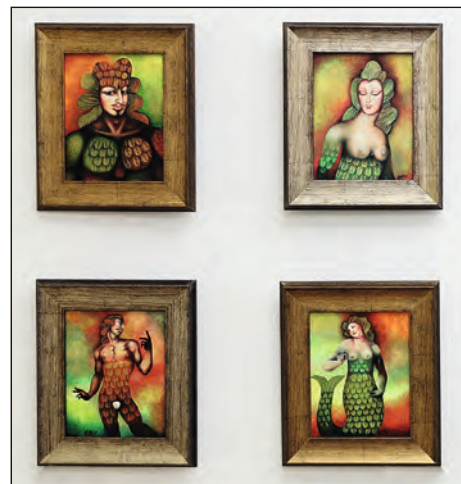
Silény a Nymfy, 2019, oleje, 25 x 20 cm