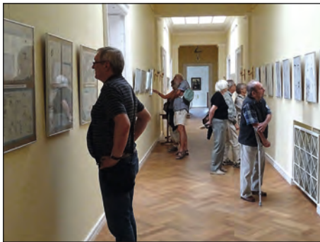
Část expozice s kresleným humorem